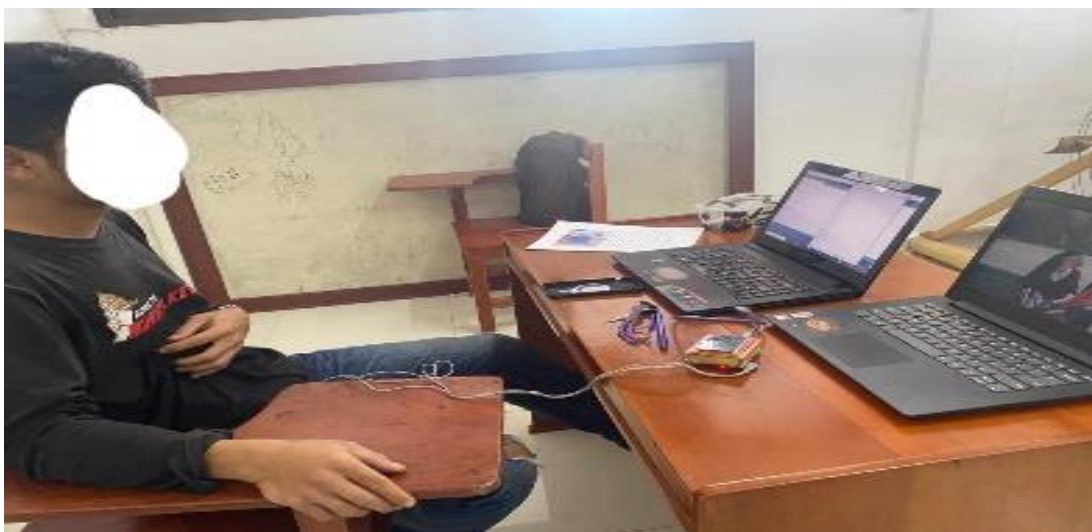
9. Partisipan 9