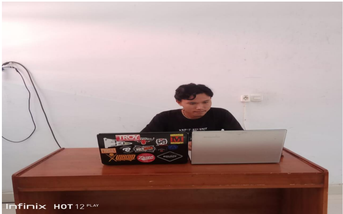
10. Partisipan 10