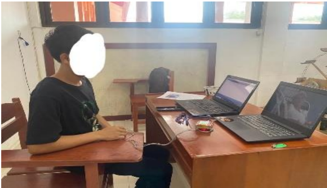
12. Partisipan 12