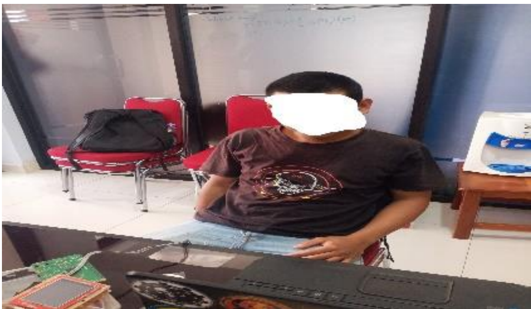
7. Partisipan 7