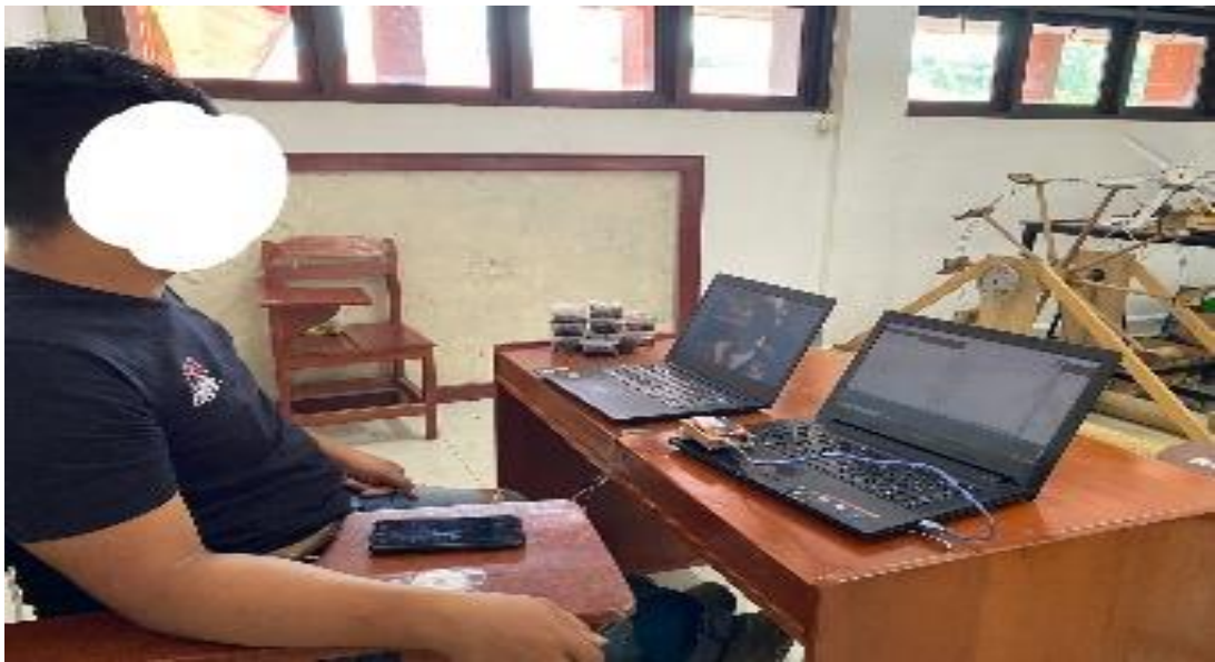
14. Partisipan 14