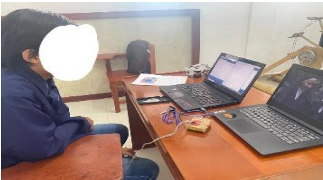
13. Partisipan 13