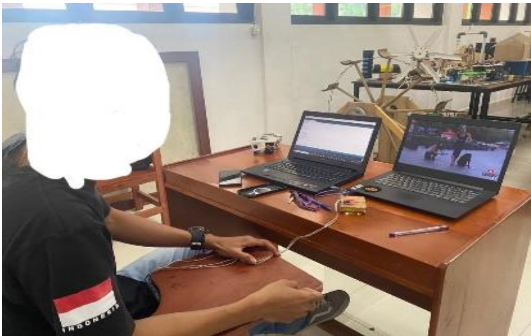
5. Partisipan 5