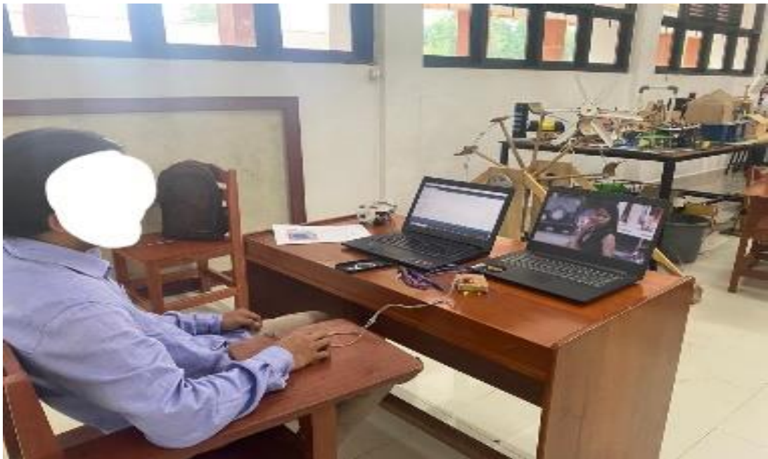
6. Partisipan 6