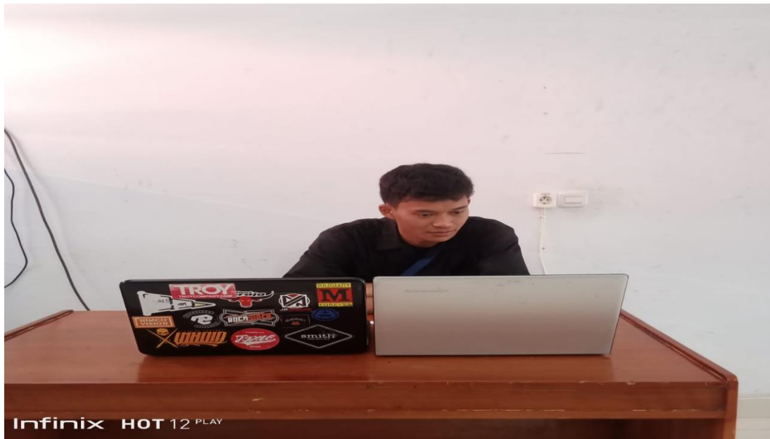
8. Partispan 8