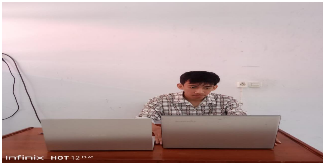
11. Partisipan 11