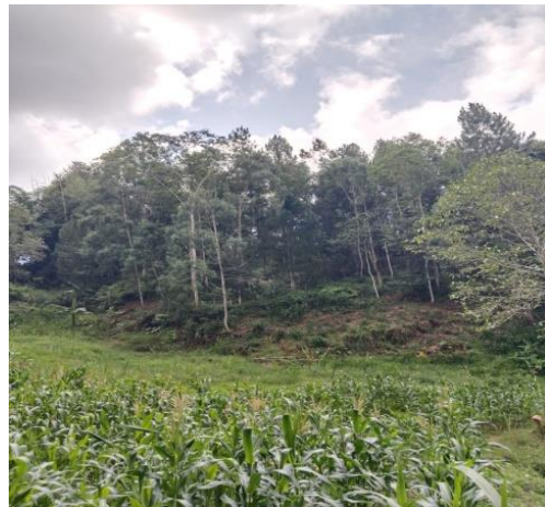
Gambar keseluruhan tanaman