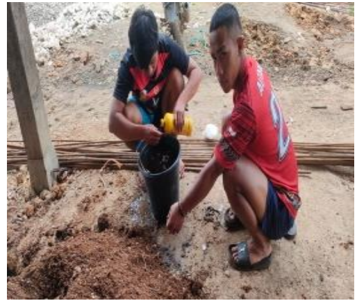
Gambar pembuatan pupuk organik