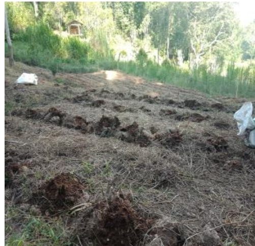
Gambar Pemupukan dasar