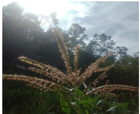
Gambar bunga jantan