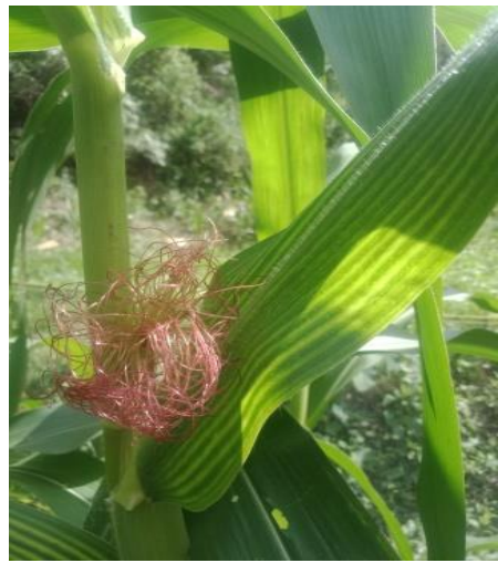
Gambar bunga betina