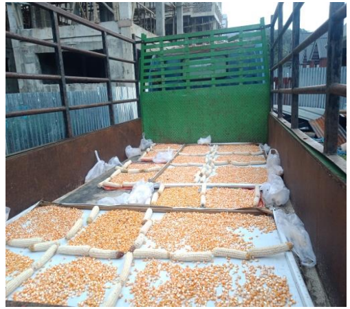
Gambar Tahap pengeringan