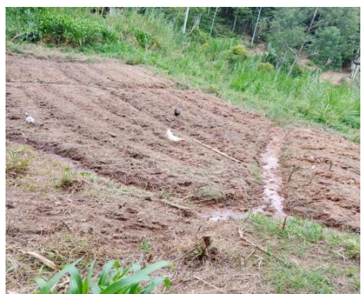
Gambar persiapan lahan