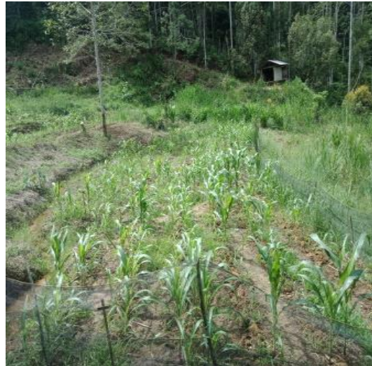
Gambar tanamandi usia mudah