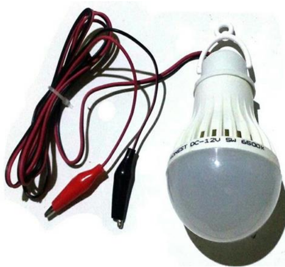
Gambar 2.4 Lampu DC

Untuk menguji panel surya dengan lampu DC, kita membutuhkan beberapa alat, seperti multimeter, lampu 12 volt, kabel penghubung, dan panel surya itu sendiri. Dengan cara ini, kita dapat mengetahui perubahan karakteristik tegangan, arus serta daya yang dihasilkan panel surya akibat dari perubahan sudut kemiringan pada permukaan panel surya yang diuji menggunakan lampu DC, lampu ini akan dihubungkan secara langsung pada panel surya.