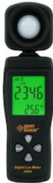
Gambar 2.6 Lux Meter