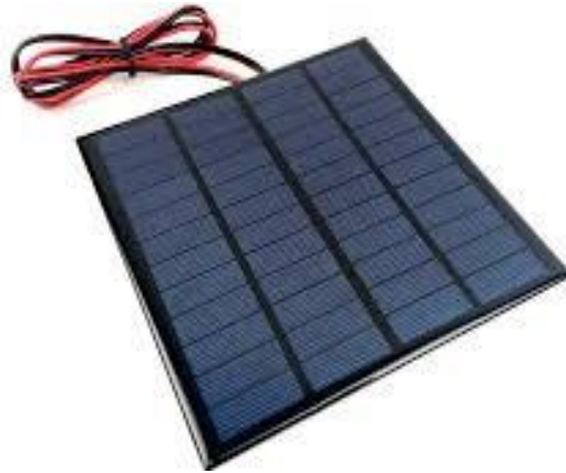
Gambar 2.1 solar cell

dari semikonduktor tipe-n ke tipe-p, dari hal tersebut maka akan membentuk kutub positif pada semi konduktor tipe-n dan sebaliknya akan terjadi kutub negatif pada semikonduktor tipe-p , akibat dari aliran elektron dan hole ini terbentuklah medan listrik yang dimana ketika cahaya matahari mengenai susunan lapisan silikon tipe-n dan tipe-p, maka akan mendorong elektron bergerak dari semikonduktor menuju kontak negatif, yang selanjutnya dimanfaatkan sebagai listrik dan sebaliknya hole bergerak menuju kontak positif menunggu elektron datang(Dzulfikar and Broto 2016).