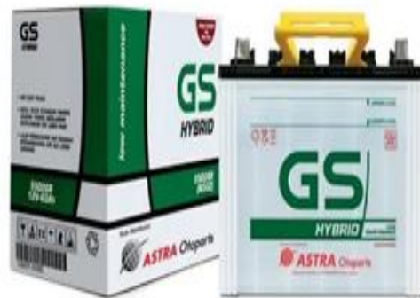
Gambar 2.3 Baterai 12 volt

Karena itu baterai tipe ini sering disebut baterai timah, Ruangan didalamnya dibagi menjadi beberapa sel dan didalam masing masing sel terdapat beberapa elemen yang terendam didalam elektrolit.