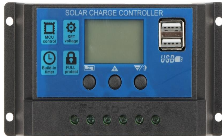
Gambar 2.2 SCC PWM

digunakan adalah solar charge jenis PWM karena jenis ini yang lebih sederhana dan lebih murah, yang mengatur arus listrik dengan cara memotong dan melepas sinyal listrik dari panel surya ke baterai.