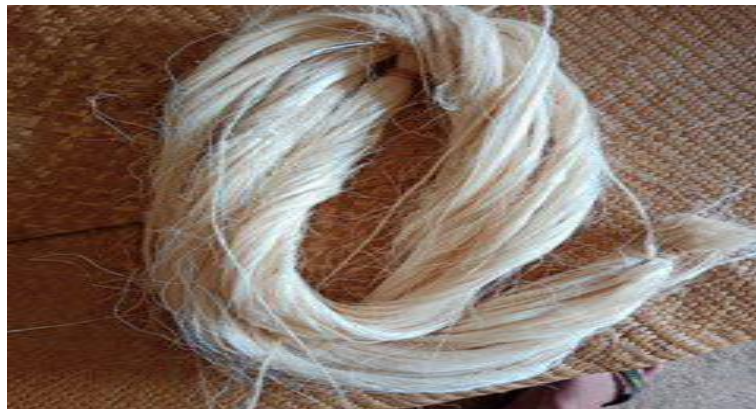
foto serat daun pandanus tectorius