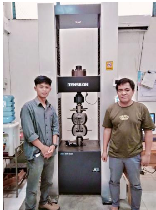
Foto bersama dengan operator di workshop las, Balai Latihan Kerja Makasar (BLK)