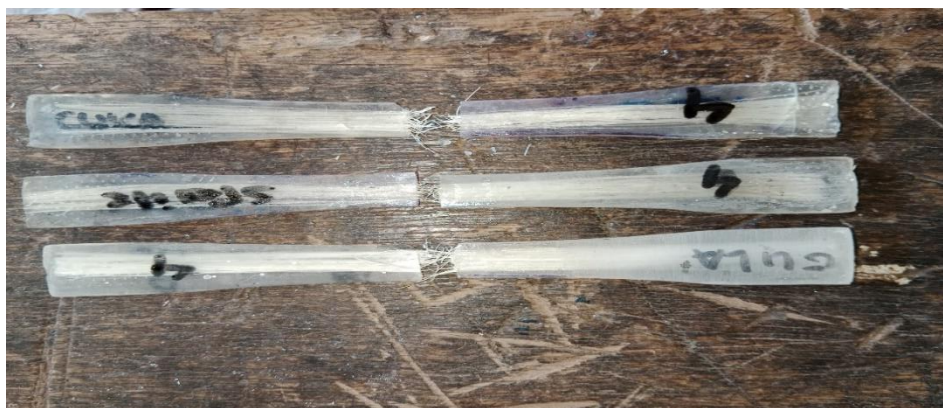
Foto di atas menunjukkan bentuk setelah pengujian kekuatan tarik