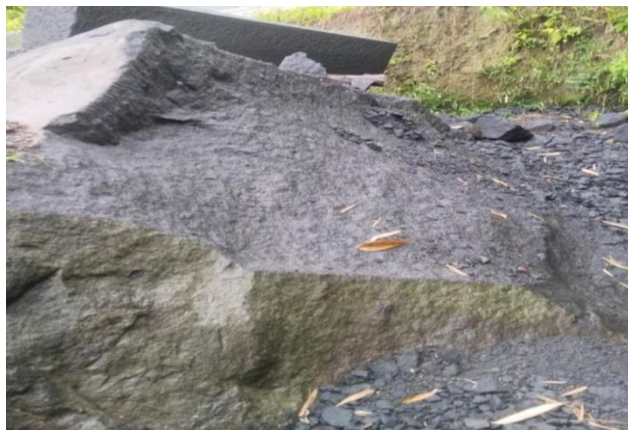
Gambar 2. 3 batu Andesit

Temuan tersebut menunjukkan bahwa batu Andesit memiliki potensi besar untuk digunakan dalam pembuatan beton struktural, karena mampu memberikan kekuatan lentur yang lebih tinggi dibandingkan beton dengan agregat konvensional. Berdasarkan hasil penelitian tersebut, penelitian ini akan melanjutkan dan memperluas kajian dengan fokus pada pemanfaatan batu Andesit sebagai agregat halus, bukan lagi sebagai agregat kasar. Tujuannya adalah untuk mengeksplorasi lebih lanjut pengaruh serbuk batu Andesit terhadap kuat lentur balok beton, sekaligus menilai efektivitasnya sebagai material substitusi pasir alam dalam upaya pengembangan material beton yang berkelanjutan dan efisien.