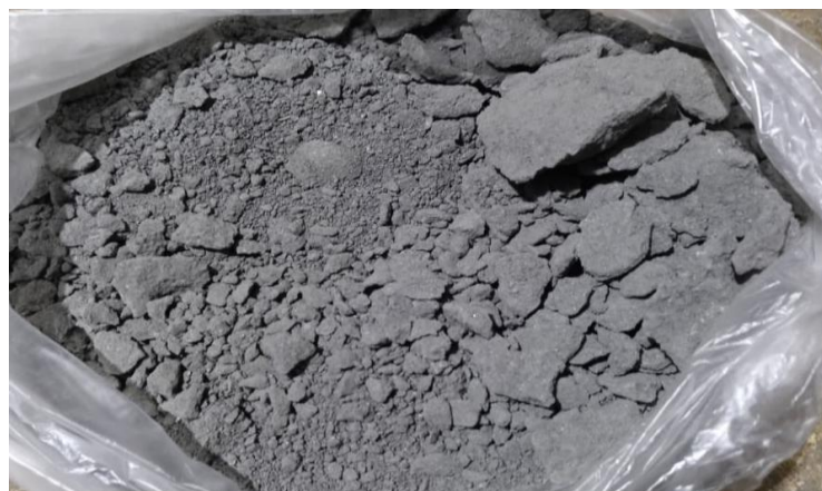
Gambar 2. 4 Serbuk batu Andesit

Dari segi lingkungan, pemanfaatan serbuk batu Andesit juga mendukung konsep konstruksi berkelanjutan ( sustainable construction ), karena mengurangi ketergantungan pada pasir alam dan meminimalkan limbah dari kegiatan penambangan batu.