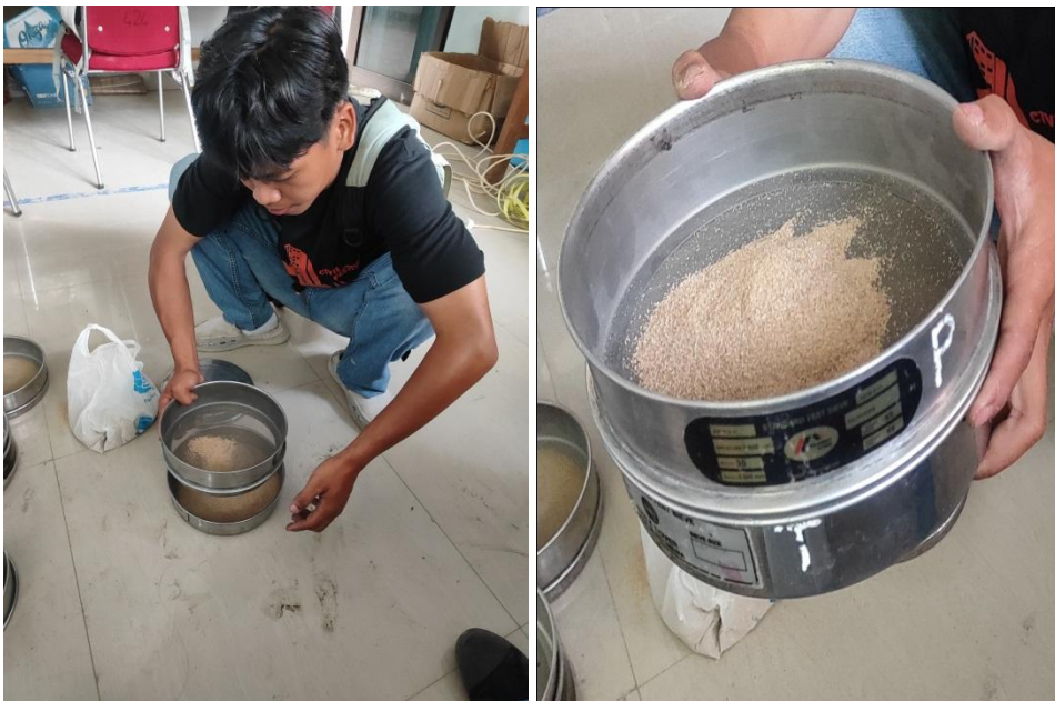
Penyaringan Serbuk Kayu