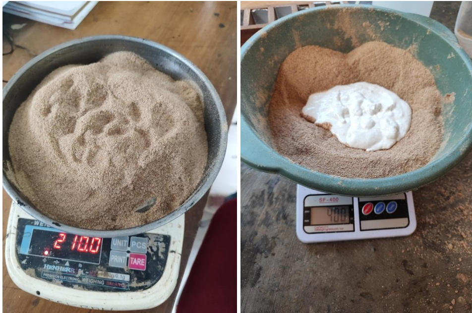
Menimbang Pebandingan Serbuk Kayu dan Bahan Perekat