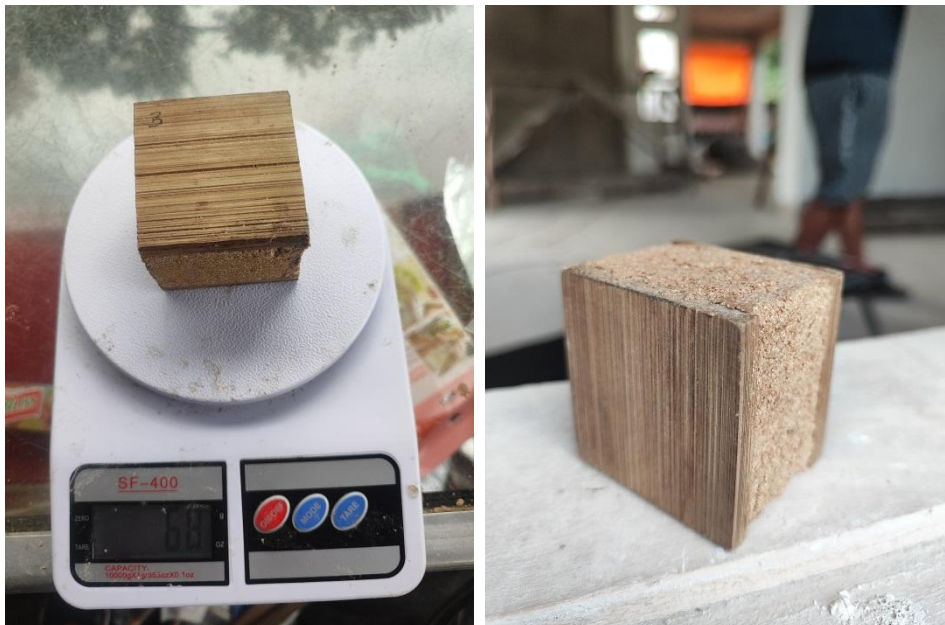
Sampel Yang Telah Jadi Setelah Proses Perawatan dan Siap Untuk Diuji