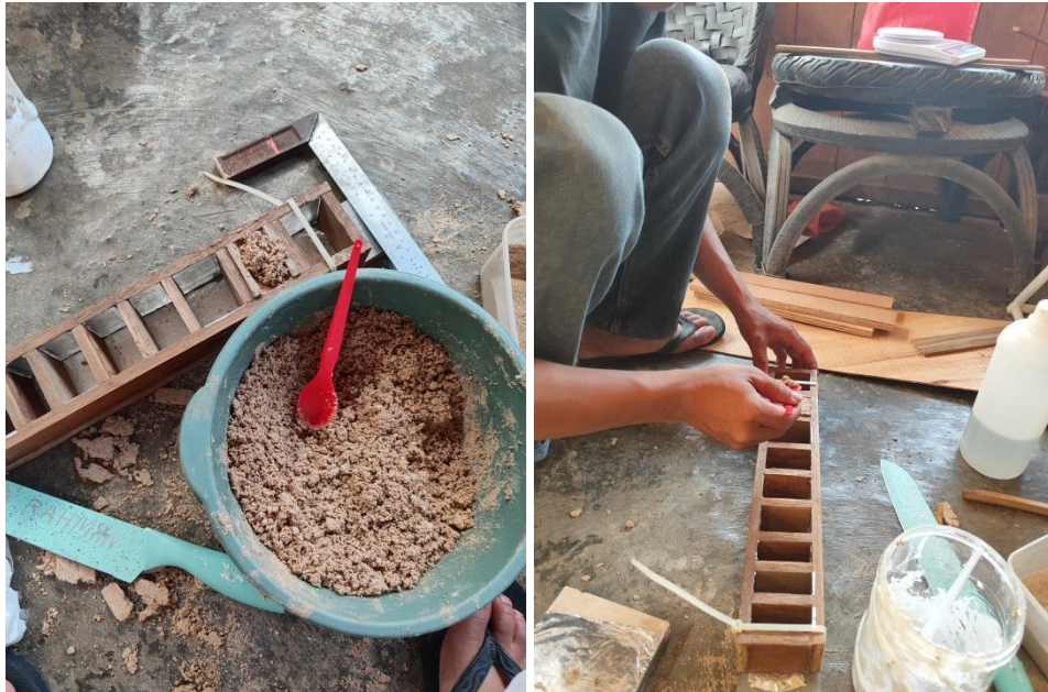
Pengisian Hasil Campuran Serbuk Kayu dan Perekat Kedalam Cetakan