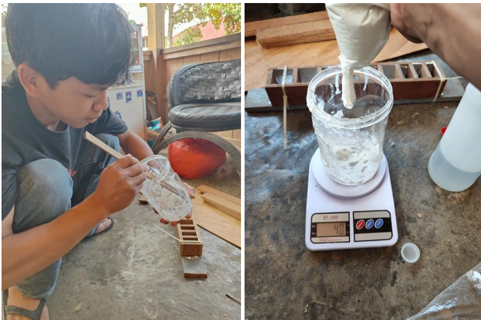
Pencampuran Bahan Perekat Resin Polyester dan Lem kayu PVAc