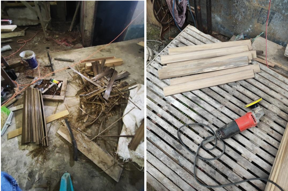
Pembelahan Bambu dengan ukuran 5 – 5,5 cm dan Penghalusan Permukaan Bambu