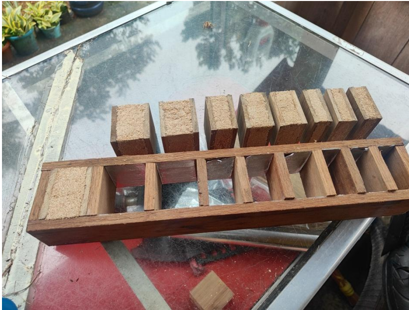
Melepaskan Sampel dari Cetakan