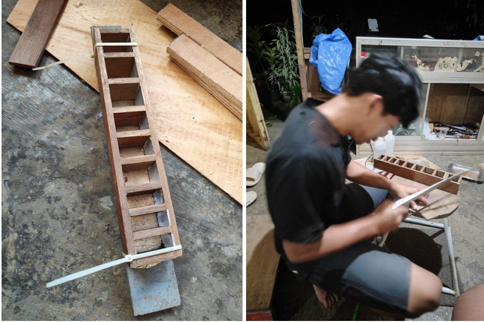
Pemasangan Cetakan Sampel dan Pemotongan Bambu dengan ukuran 5 cm