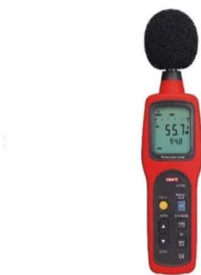
Gambar 2.3 UNI-T UT352 Sound Level Meter

Sound Level Meter (SLM) merupakan suatu alat yang digunakan untuk mengukur tingkat kebisingan atau intensitas suara di suatu lingkungan. Alat ini bekerja dengan cara menangkap gelombang suara menggunakan mikrofon dan mengonversinya menjadi nilai numerik yang biasanya dinyatakan dalam satuan decibel (dB). Sound Level Meter biasanya digunakan di lingkungan kerja seperti, industri penerbangan. Selain itu Sound level Meter juga dapat digunakan untuk memverifikasi persis berapa banyak tingkat suara telah berubah. Semua Sound Level Meter memiliki fitur pengukuran pengukur kondensor mikrofon omnidirectional, preamp pic, jaringan pembobotan frekuensi, rangkaian detector RMS, layar pengukuran, AC dan DC output yang digunakan untuk merekam hasil data pengukuran (Delvi Kusuma,2015).