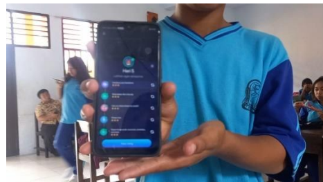
Treatment (Fifth Meeting)