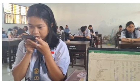
Treatment (Sixth Meeting )