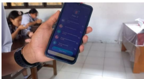
Treatment (Second Meeting )