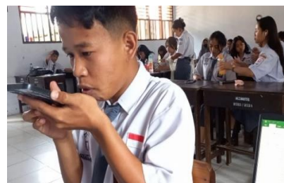
Treatment (Third Meeting)