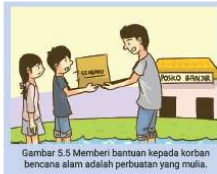
Gambar 5.5 Memberi bantuan kepada korban bencana alam adalah perbuatan yang mulia.

langsung atau dititipkan kembali kepada Posko penampungan bantuan untuk korban bencana alam.