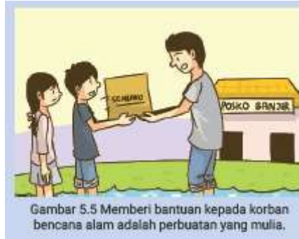
Gambar 5.5 Memberi bantuan kepada korban bencana alam adalah perbuatan yang mulia.

Tidak hanya itu, Nina, Rafi dan Yuni suka memberi bantuan kepada korban bencana alam. Selain itu, mereka sering mengumpulkan bantuan dari teman-teman yang lain, guru atau anggota masyarakat lainnya. Kemudian, mereka menyerahkannya kepada korban bencana alam secara langsung atau dititipkan kembali kepada Posko penampungan bantuan untuk korban bencana alam.