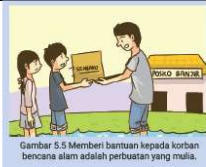
Gambar 5.5 Memberi bantuan kepada korban bencana alam adalah perbuatan yang mulia.

Hidup rukun, saling berbagi dan tolong-menolong adalah perbuatan yang mulia dan membuat hidup kita bahagia. Kita dapat mempunyai banyak teman sehingga kita tidak menjadi sedih dan kesepian karena di sekeliling kita banyak teman yang menemani dalam hidup kita. Selain itu, kita menjadi disayangi oleh orang tua, guru, teman, dan anggota masyarakat lainnya. Hidup rukun, saling berbagi dan saling tolong dengan sesama termasuk nilai-nilai gotong royong.