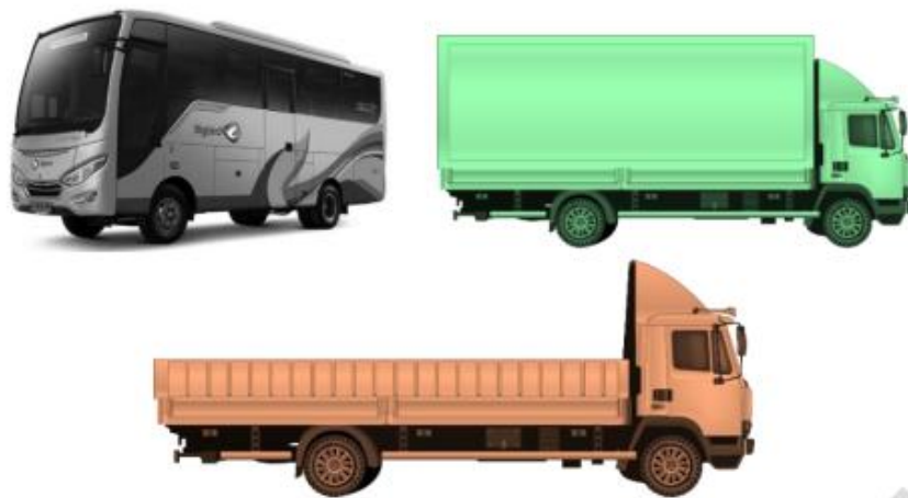
Tipikal kendaraan dalam kategori kendaraan sedang