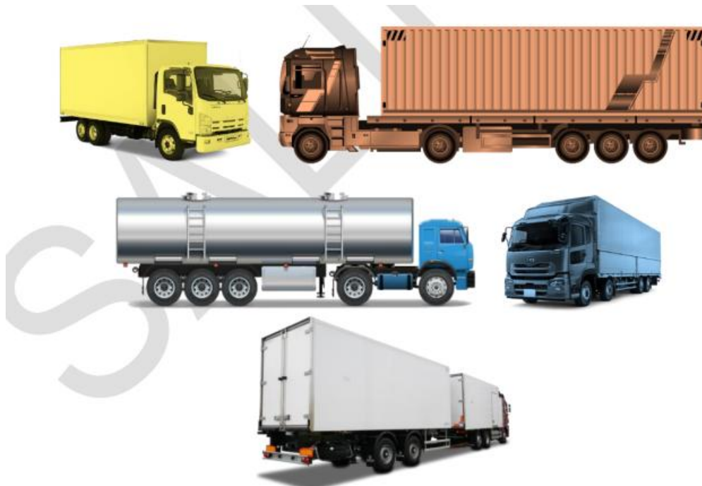
Tipikal kendaraan dalam kategori truk besar