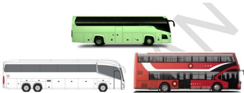
Tipikal kendaraan dalam kategori bus besar