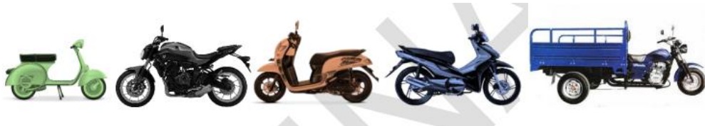
Tipikal kendaraan dalam kategori sepeda motor